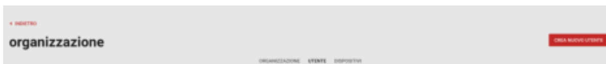
Figura 3: Creare la cartella

Cliccando su " Crea cartella " è possibile inserire nuove cartelle. Viene richiesto di inserire un nome, che può essere modificato in qualsiasi momento