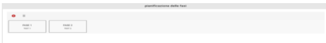
Figura 13: Pianificazione delle fasi

Si esegue infine la pianificazione delle fasi. È possibile creare, copiare, spostare e cancellare le fasi. Nelle fasi sono salvati tutti i parametri vitali del paziente. La fase 1 può quindi essere considerata la fase iniziale. Ogni altra fase rappresenta una modifica del paziente.