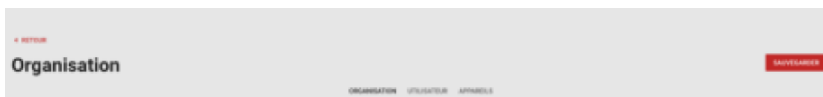
Figure 3 : Créer un dossier

Vous pouvez créer de nouveaux dossiers en cliquant sur « Créer un dossier ». On vous demandera de saisir un nom. Il peut être modifié à tout moment