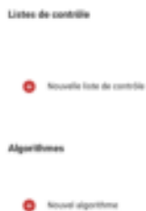
Figure 12 : Créer des listes de contrôle

Les phases sont divisées en quatre domaines des valeurs vitales.