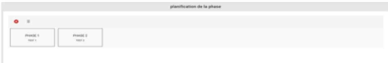
Figure 13 : Planification des phases

Ensuite est effectuée la planification des phases. Vous pouvez créer, copier, déplacer et supprimer des phases. Toutes les valeurs vitales du patient sont enregistrées dans les phases. Par conséquent, la phase 1 peut être considérée comme phase initiale. Chaque phase ultérieure représente une modification de l'état du patient.