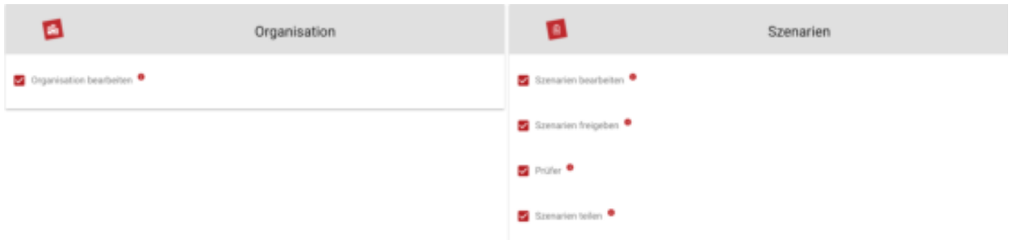
Abbildung 2: Rollen für Benutzer festlegen