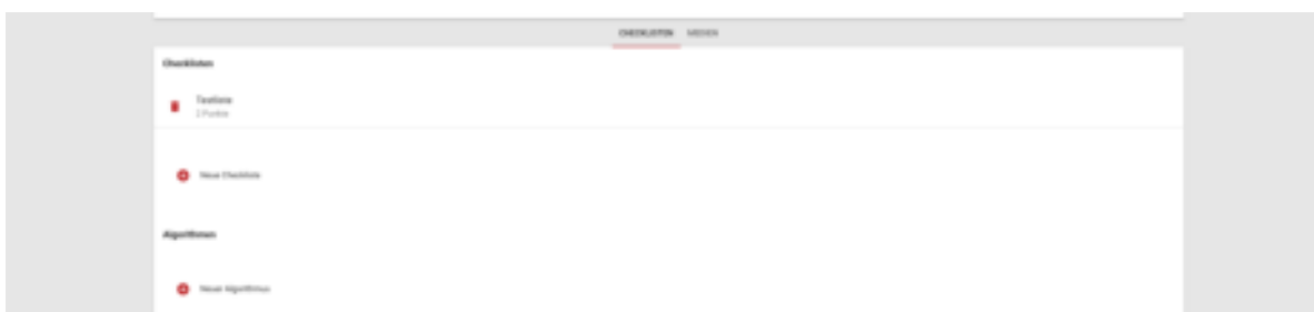
Abbildung 12: Checklisten anlegen

Die Phasen werden in vier Bereiche für die Vitalwerte unterteilt.