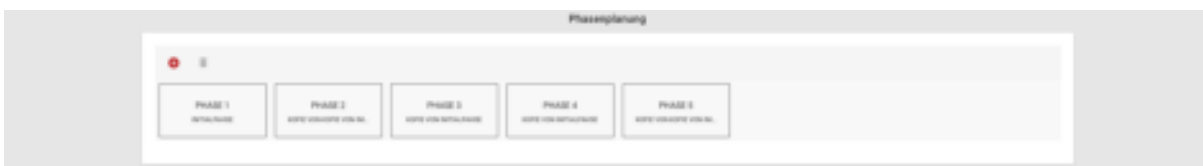
Abbildung 13: Phasenplanung

Abschließend wird die Phasenplanung durchgeführt. Sie können Phasen erstellen, kopieren, verschieben und löschen. In den Phasen sind alle Vitalwerte des Patienten gespeichert. Daher kann die Phase 1 als Initialphase angesehen werden. Jede weitere Phase stellt eine Patientenveränderung dar.